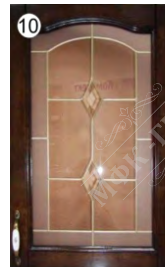
Двойной ромб (стекло квадрат на прозрачном стекле)

Варианты деколей: солнце, пшеница, роза, кувшин, ваза, квадрат.