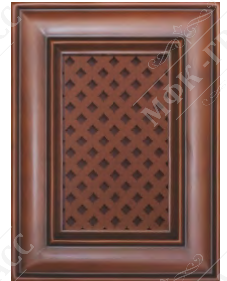
Фасад с решеткой*

*Возможно исполнение прямых и рамочных фасадов как в прямом, так и радиусном варианте.