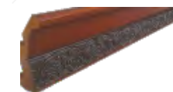
Карниз резной № 1 (вставка Н= 48мм) Н=110мм