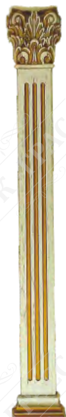
Резная колонна 75/100/150мм