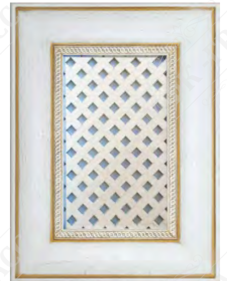
Фасад с решеткой*

*Возможно исполнение прямых и рамочных фасадов как в прямом, так и радиусном варианте.