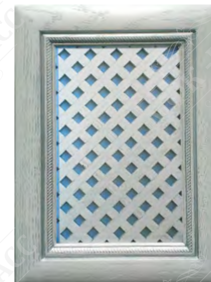
Фасад с решеткой*

*Возможно исполнение прямых и рамочных фасадов как в прямом, так и радиусном варианте.