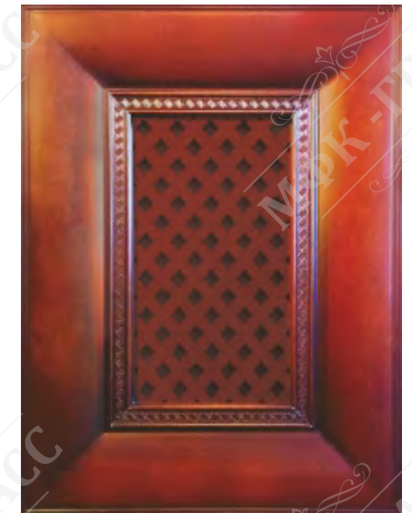
Фасад с решеткой*

*Возможно исполнение прямых и рамочных фасадов как в прямом, так и радиусном варианте.