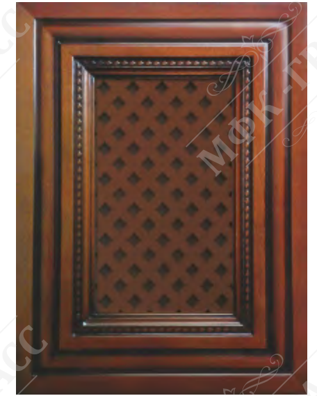
Фасад с решеткой*

*Возможно исполнение прямых и рамочных фасадов как в прямом, так и радиусном варианте.