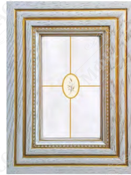
Фасад рамочный под стекло*