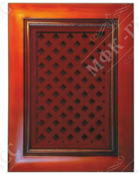
Фасад с решеткой*

*Возможно исполнение прямых и рамочных фасадов как в прямом, так и радиусном варианте.