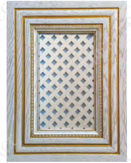
Фасад с решеткой*

*Возможно исполнение прямых и рамочных фасадов как в прямом, так и радиусном варианте.