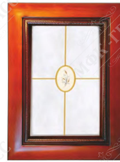
Фасад рамочный под стекло*