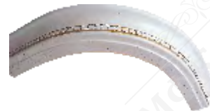
Карниз « Со вставкой» радиус 315/315 Н=64мм