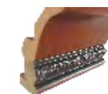
Карниз резной № 2 (вставка Н= 25мм) Н=96мм