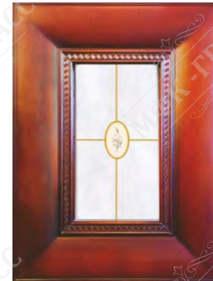
Фасад рамочный под стекло*