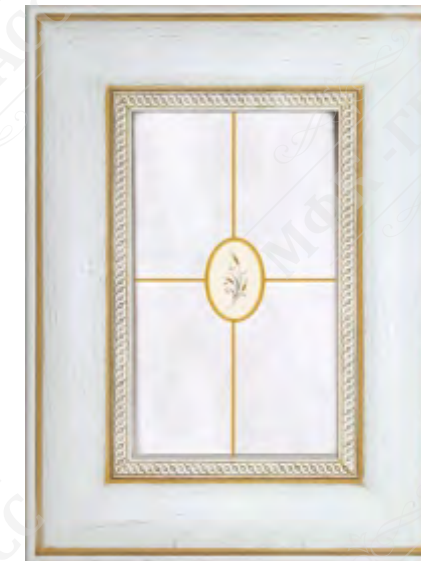
Фасад рамочный под стекло*