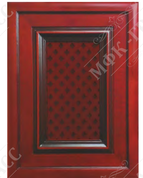
Фасад с решеткой*

*Возможно исполнение прямых и рамочных фасадов как в прямом, так и радиусном варианте.