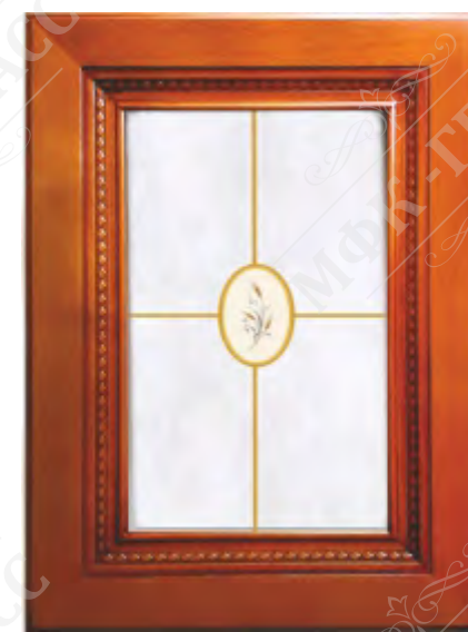
Фасад рамочный под стекло*