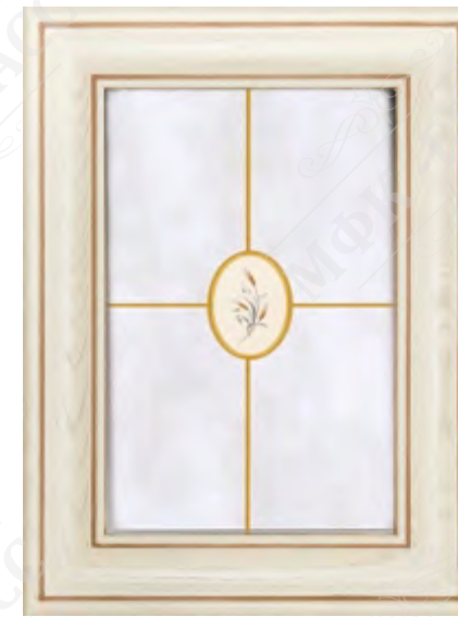
Фасад рамочный под стекло*