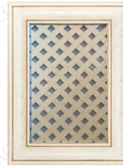
Фасад с решеткой*

*Возможно исполнение прямых и рамочных фасадов как в прямом, так и радиусном варианте.