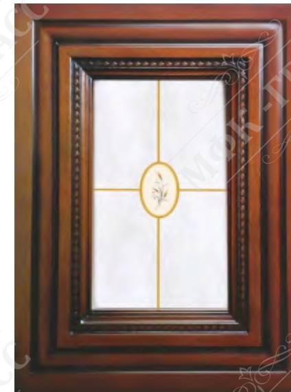
Фасад рамочный под стекло*