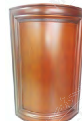
Радиусный фасад под любую из представленных в разделе форм (филенка прямая на всех формах)

Шпонированный листовый материал можно использовать как весьма стильный и утонченный элемент декора. Представленные в коллекции древесные рисунки плит лаконично дополняют интерьерную композицию в виде оригинальных стеновых панелей, изящных перегородок, авторских декоративных элементов. Вы сможете добиться неповторимой эстетики, вплетая естественные линии живой природы в ваш уникальный интерьерный рисунок.