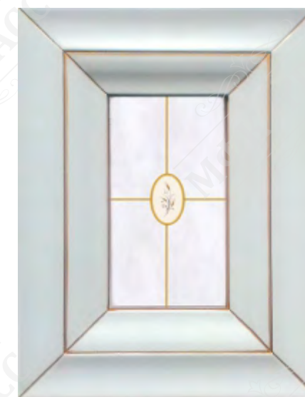
Фасад рамочный под стекло*