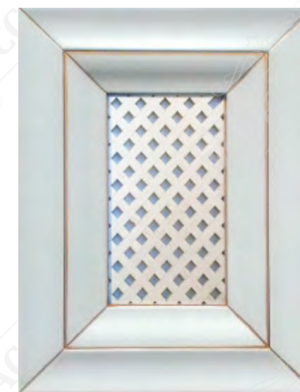
Фасад с решеткой*

*Возможно исполнение прямых и рамочных фасадов как в прямом, так и радиусном варианте.