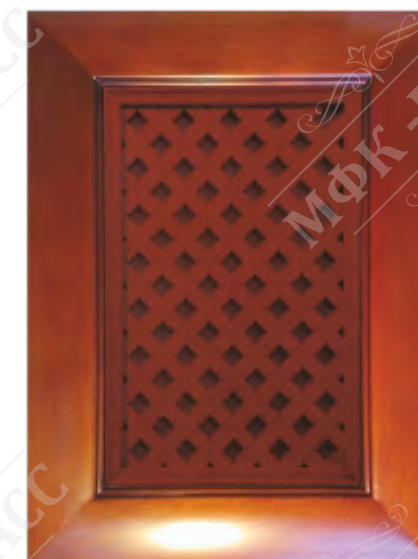
Фасад с решеткой*

*Возможно исполнение прямых и рамочных фасадов как в прямом, так и радиусном варианте.