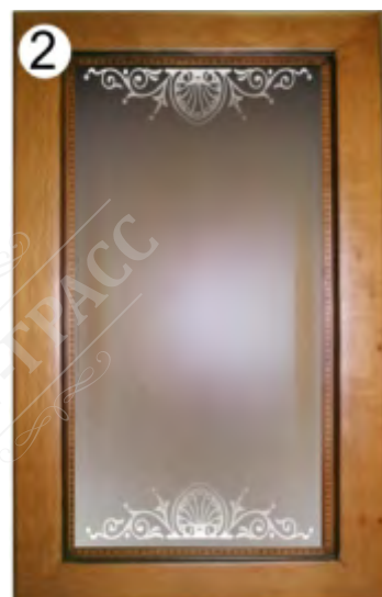
В 21 пескоструйка