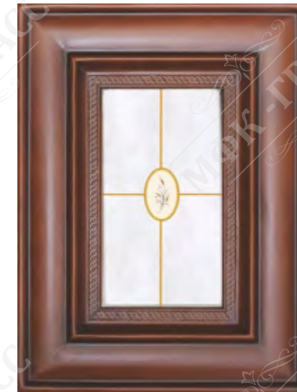
Фасад рамочный под стекло*