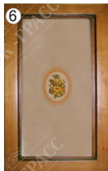
С выдавленной по центру розой