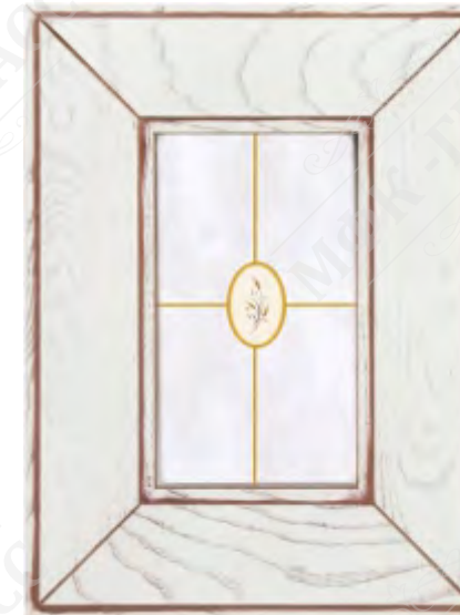
Фасад рамочный под стекло*