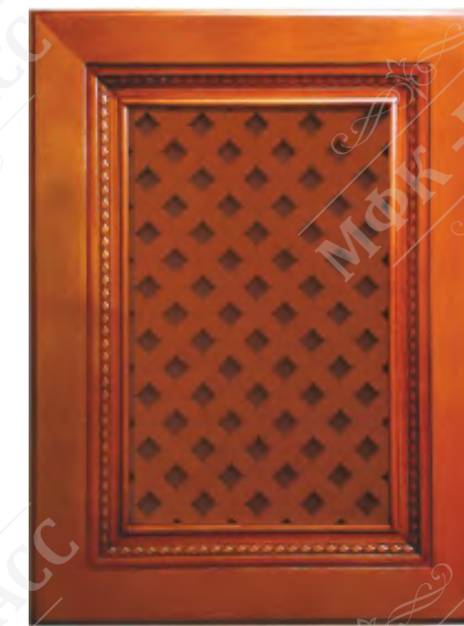
Фасад с решеткой*

*Возможно исполнение прямых и рамочных фасадов как в прямом, так и радиусном варианте.