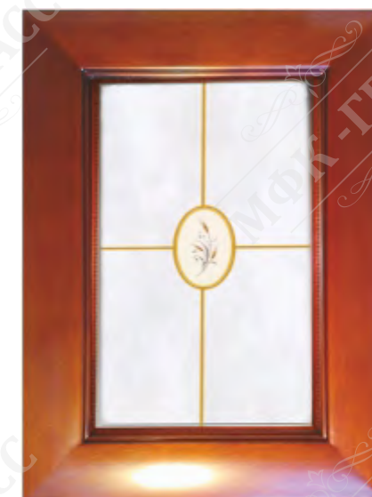
Фасад рамочный под стекло*