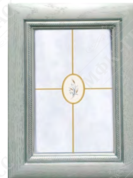
Фасад рамочный под стекло*