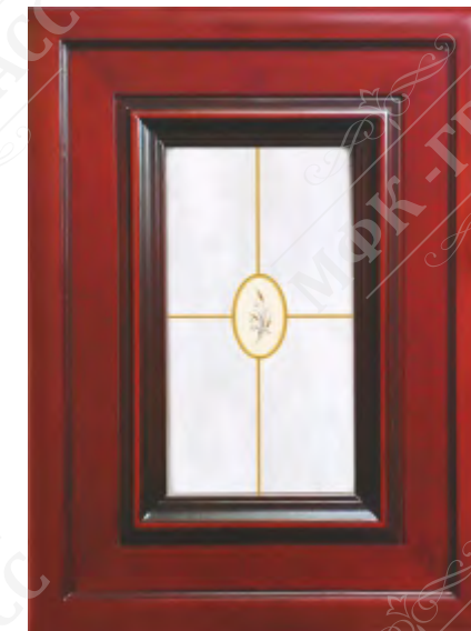
Фасад рамочный под стекло*